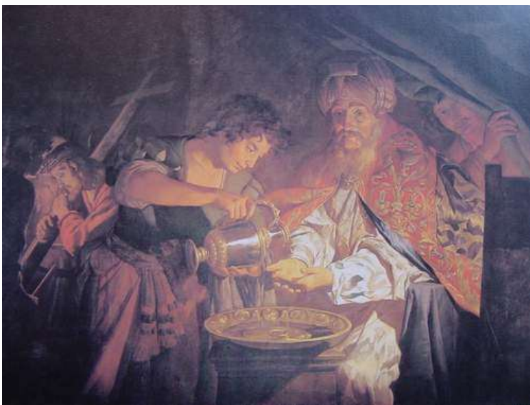
史托莫 彼拉多洗手 1650

正坐堂的時候，他的夫人打發人來說：這義人的事，你一點不可管，因為我今天在夢中為他受了許多的苦。