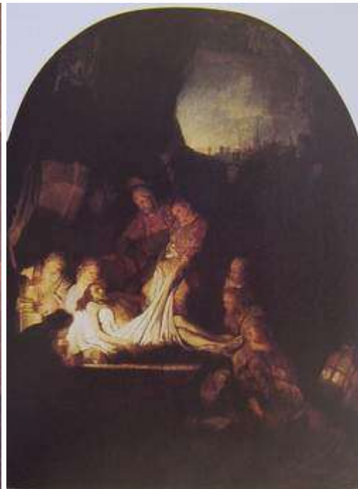
林布蘭特 入墳 1637