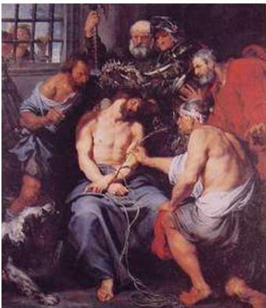
范戴克 嘲弄 1634

彼拉多又出來對眾人說：我帶他出來見你們，叫你們知道我查不出他有什麼罪來。耶穌出來，戴著荊棘冠冕，穿著紫袍。彼拉多對他們說：你們看這個人！