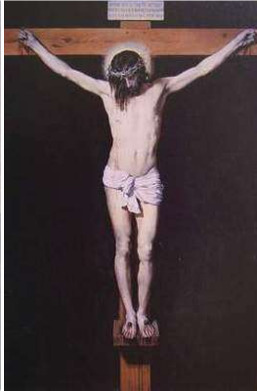
委拉茲蓋茲 成了 1632