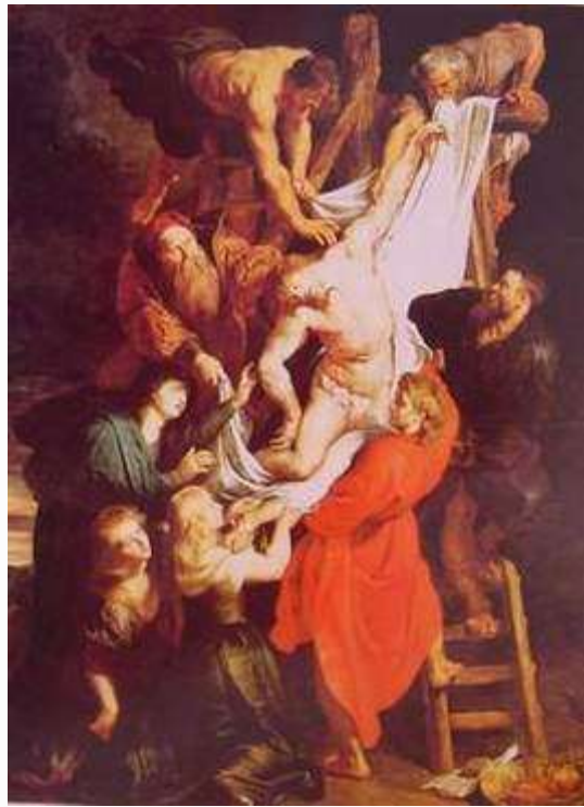
魯本斯 卸下聖體 1612