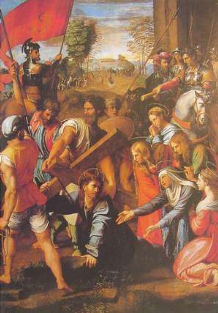
拉斐爾 西門協助背十字架 1517

這幅由馬德里·普拉多美術館收藏，文藝復興巨匠拉斐爾畫的「西門協力抬起十字架」，說出很多的訊息。耶穌背負起沉重十字架往髑髏崗上時，由於體力不支，一位從古利奈來的叫西門的人，被士兵們命令抬起十字架。拜占庭的「畫家指南」上記載著：「耶穌筋疲力盡，被石頭絆到，倒在地上，古利奈人西門路過此，他生有落腮鬍子，灰鬍黑捲髮，身著短裝，當即把十字架抬起扛到自己肩上。」