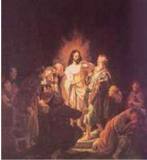
林布蘭特 多馬懷疑 1634