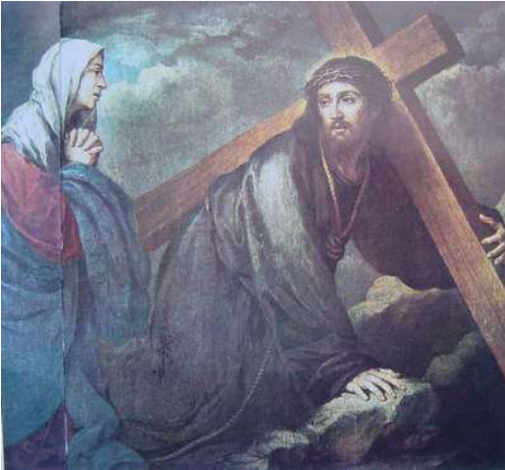
慕里歐 耶穌遇見母親馬利亞 1670