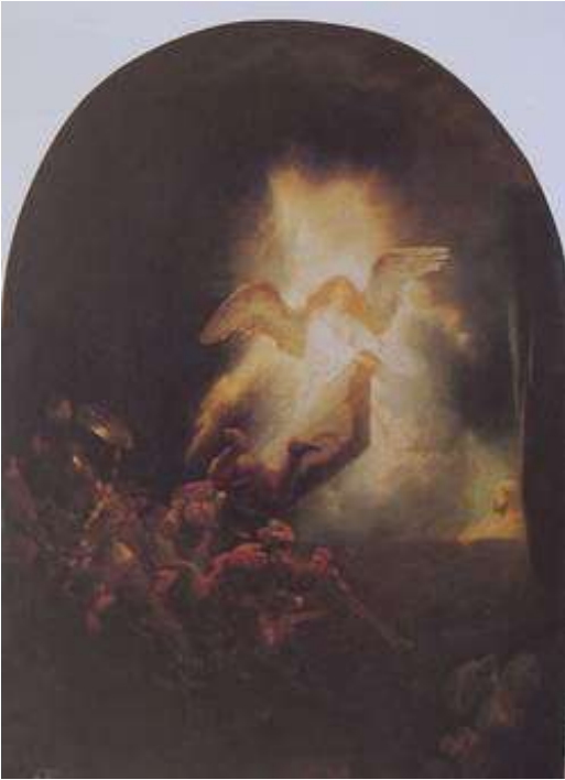
林布蘭特 復活 1639