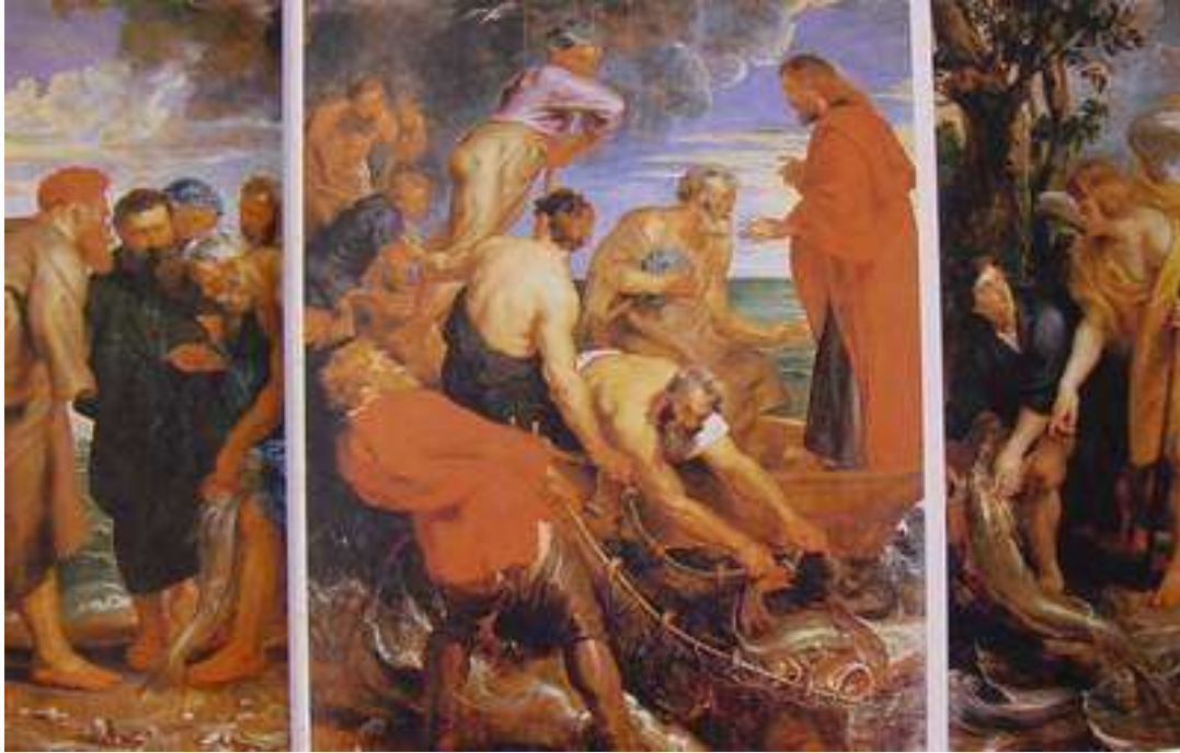
魯本斯 耶穌在捕魚時顯現 1619

他們吃完了早飯，耶穌對西門彼得說：約翰（在太 16：17 稱約拿）的兒子西門，你愛我比這些更深嗎？彼得說：主阿，是的，你知道我愛你。耶穌對他說：你餵養我的小羊。耶穌第二次又對他說：約翰的兒子西門，你愛我嗎？彼得說：主阿，是的，你知道我愛你。耶穌說：你牧養我的羊。第三次對他說：約翰的兒子西門，你愛我嗎？彼得因為耶穌第三次對他說你愛我嗎，就憂愁，對耶穌說：主阿，你是無所不知的；你知道我愛你。耶穌說：你餵養我的羊。我實實在在的告訴你，你年少的時候，自己束上帶子，隨意往來；但年老的時候，你要伸出手來，別人要把你束上，帶你到不願意去的地方。耶穌說這話是指著彼得要怎樣死，榮耀神。說了這話，就對他說：你跟從我吧！