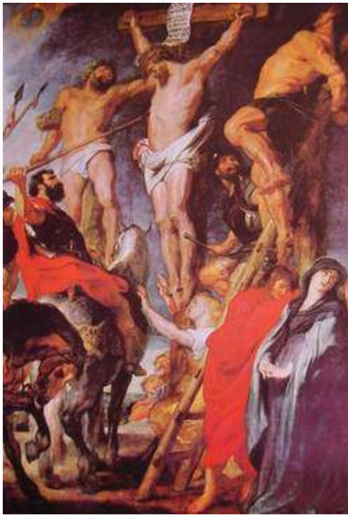
魯本斯 兵丁用矛刺耶穌 1620