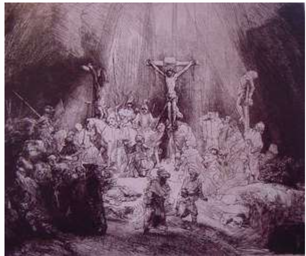
林布蘭特版畫 耶穌和兩個強盜

那同釘的兩個犯人有一個譏誚他，說：你不是基督嗎？可以救自己和我們吧！那一個就應聲責備他，說：你既是一樣受刑的，還不怕神嗎？我們是應該的，因我們所受的與我們所作的相稱，但這個人沒有作過一件不好的事。就說：耶穌阿，你得國降臨的時候，求你記念我！耶穌對他說：我實在告訴你，今日你要同我在樂園裡了