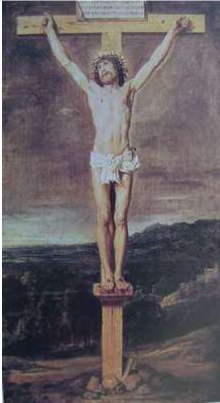
委拉茲蓋茲 受難 1630

利亞呢！內中有一個人趕緊跑去，拿海絨蘸滿了醋，綁在葦子上，送給他喝。其餘的人說：且等著，看以利亞來救他不來。耶穌又大聲喊叫，氣就斷了。忽然，殿裡的幔子從上到下裂為兩半，地也震動，磐石也崩裂，墳墓也開了，已睡聖徒的身體多有起來的。到耶穌復活以後，他們從墳墓裡出來，進了聖城，向許多人顯現。百夫長和一同看守耶穌的人看見地震並所經歷的事，就極其害怕，說：這真是神的兒子了！