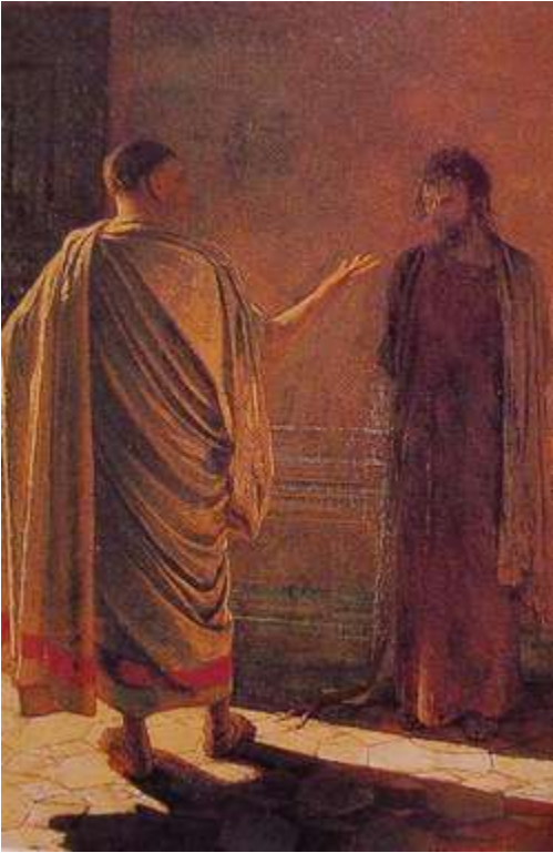
維吉奇 真理是什麼？1890