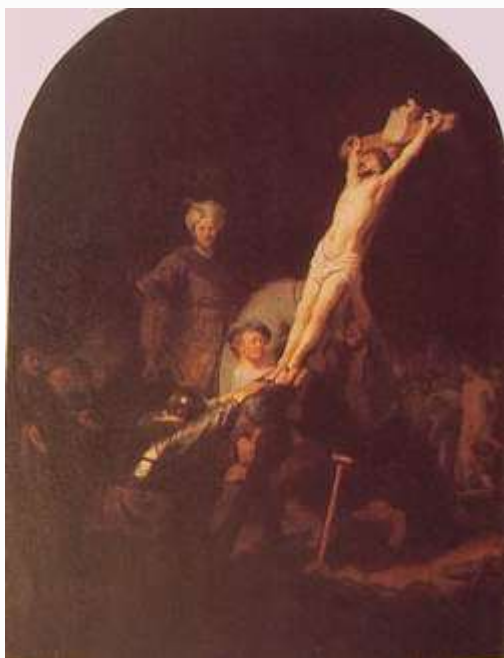
林布蘭特 舉起十字架 1633

他們就把耶穌帶了去。耶穌背著自己的十字架出來，到了一個地方，名叫髑髏地，希伯來話叫各各他。他們就在那裡釘他在十字架上，還有兩個人和他一同釘著，一邊一個，耶穌在中間。彼拉多又用牌子寫了一個名號，安在十字架上，寫的是：猶太人的王，拿撒勒人耶穌。有許多猶太人念這名號；因為耶穌被釘十字架的地方與城相近，並且是用希伯來、羅馬、希利尼三樣文字寫的。猶太人的祭司長就對彼拉多說：不要寫猶太人的王，要寫他自己說：我是猶太人的王。彼拉多說：我所寫的，我已經寫上了。