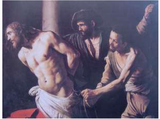
卡拉瓦喬 耶穌被鞭打 1607

巡撫的兵就把耶穌帶進衙門，叫全營的兵都聚集在他那裡。他們給他脫了衣服，穿上一件朱紅色袍子，用荊棘編作冠冕，戴在他頭上，拿一根葦子放在他右手裡，跪在他面前，戲弄他，說：恭喜，猶太人的王阿！又吐唾沫在他臉上，拿葦子打他的頭。戲弄完了，就給他脫了袍子，仍穿上他自己的衣服。