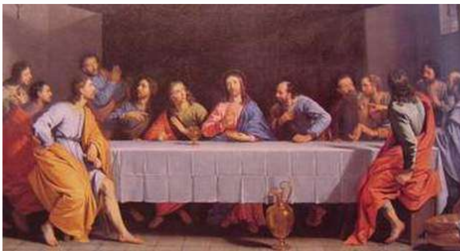
尚佩恩(Champaigne) 最後晚餐 1650

十七世紀時，由方濟會士聖利安納(St. Leonard of Port Maurice)大力宣傳「苦路」的祈禱，並從比拉多衙門到各各他山的行程中安排了十四個站，這十四個站，內容來自口述傳說與聖經四福音書。