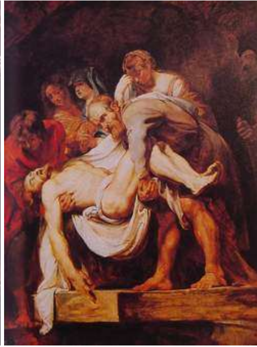
魯本斯 入墳 1615