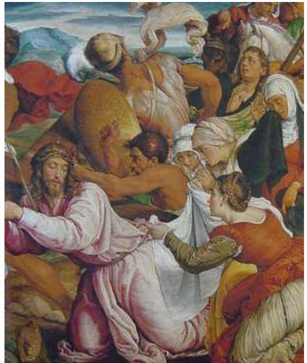
巴撒諾 耶穌安慰耶路撒冷婦女們 1582

有許多百姓跟隨耶穌，內中有好些婦女；婦女們為他號咷痛哭。耶穌轉身對他們說：耶路撒冷的女子，不要為我哭，當為自己和自己的兒女哭。因為日子要到，人必說：不生育的，和未曾懷胎的，未曾乳養嬰孩的，有福了！那時，人要向大山說：倒在我們身上！向小山說：遮蓋我們！這些事既行在有汁水的樹上，那枯乾的樹將來怎麼樣呢？