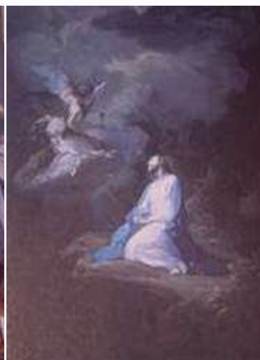
加奎多(Giaquinto) 客西馬尼園的禱告 1750

馬丁路德改革天主教成為基督教後，一樣重視耶穌受難的默想，但他挪走口述傳說的內容，只專一於聖經經文中對耶穌受難的描述。因此來自基督教背景的巴哈所創作的「馬太受難曲」「約翰受難曲」，不僅革新了宗教曲式，也是緊貼聖經經文默想受難的典型範例。