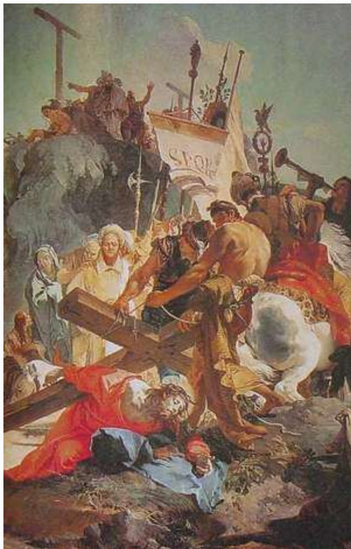
提也波洛 耶穌跌倒 1738