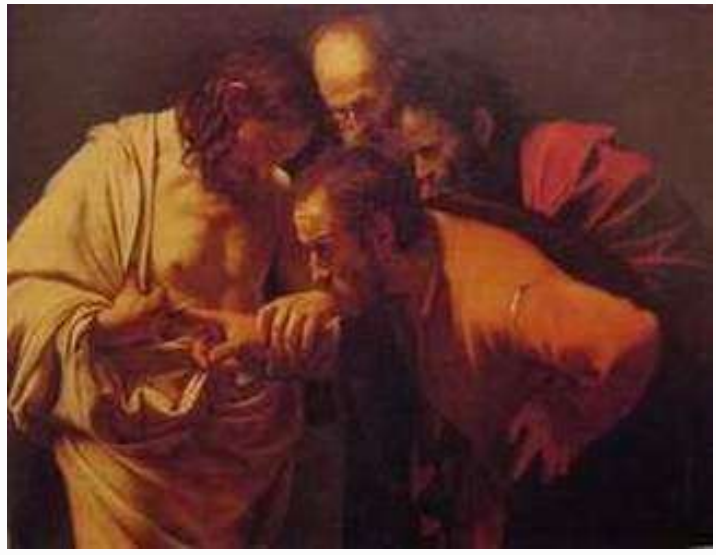
卡拉瓦喬 多馬懷疑 1603