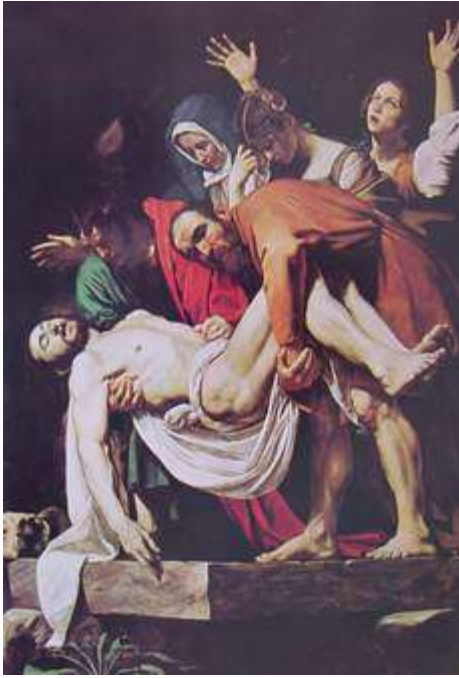
卡拉瓦喬 入墳 1604