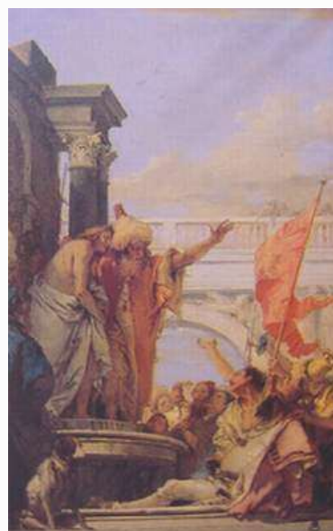
提也波洛 你們看這個人 1750