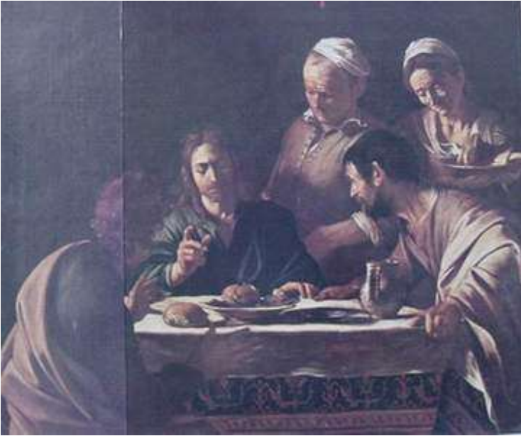
卡拉瓦喬 耶穌在以馬忤斯顯現 1606