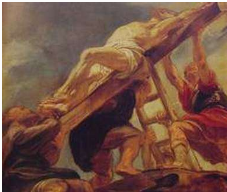
魯本斯 舉起十字架

兵丁既然將耶穌釘在十字架上，就拿他的衣服分為四分，每兵一分；又拿他的裡衣，這件裡衣原來沒有縫兒，是上下一片織成的。他們就彼此說：我們不要撕開，只要拈鬮，看誰得著。這要應驗經上的話說：他們分了我的外衣，為我的裡衣拈鬮。兵丁果然作了這事。